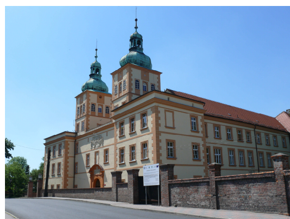
Zamek po remoncie fasady w 2011 roku