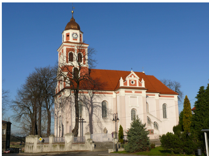
Kościół św. Jerzego po remoncie dachu w 2009 roku.