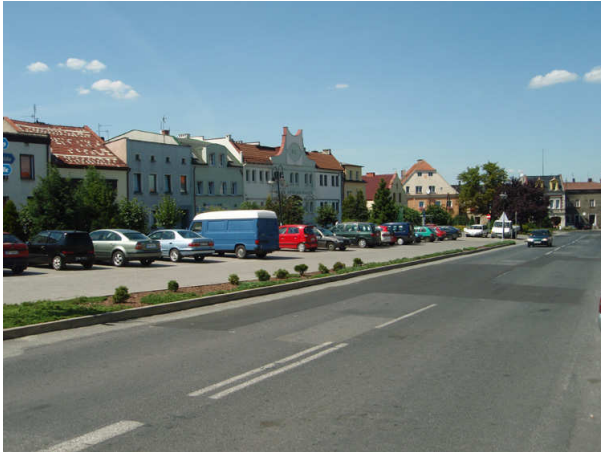
Prószkowski Rynek: miejsca parkingowe

Prószków zamieszkują: Ślązacy – ludność autochtoniczna, osoby, których rodziny przybyły na te tereny po II wojnie światowej, coraz więcej ludności z Ukrainy oraz pracownicy stali i sezonowi z innych województw, najczęściej z woj. świętokrzyskiego oraz warmińsko-mazurskiego. Liczba zameldowanych na stałe mieszkańców Prószkowa zwiększa się też ze względu na rozwój budownictwa jednorodzinnego i sprzedaży nieruchomości, również działek budowlanych oraz dzięki wybudowaniu w miejscowości bloku mieszkaniowego przez prywatnego developera. Prószków jest dla potencjalnych nowych mieszkańców miejscem atrakcyjnym do zamieszkania ze względu na położenie administracyjne i w miarę dobrze rozwiniętą infrastrukturę komunalną i społeczną.