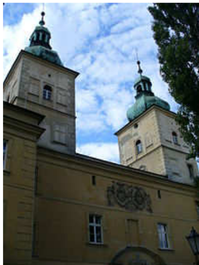
Wieże i brama zamku przed remontem

Zamek wybudowany w 1677 roku był w II połowie XIX wieku siedzibą słynnej w Europie Królewskiej Akademii Rolniczej, obecnie mieści się w nim Dom Pomocy Społecznej.