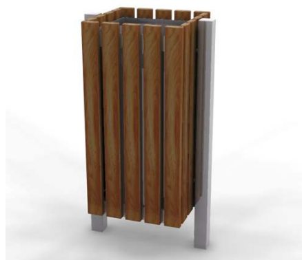
Kosz na śmieci przykładowy wyrób 13-07-09 Puczyński lub równoważne

"Uwaga: wszystkie wskazane z nazwy urządzenia, armatura, materiały, technologie należy rozumieć jako określenie wymaganych parametrów technicznych i jakościowych - oznacza to, że zgodnie z art. 29 pkt. 3 "Prawo Zamówień Publicznych" dopuszcza się składanie ofert równoważnych lub lepszych.