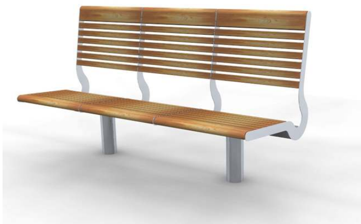
Ławka parkowa z oparciem przykładowy wyrób 07-04-02 Puczyński lub równoważne