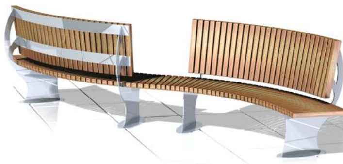
Ławka parkowa kolista przykładowy wyrób 13-04-40_01 Puczyński lub równoważne