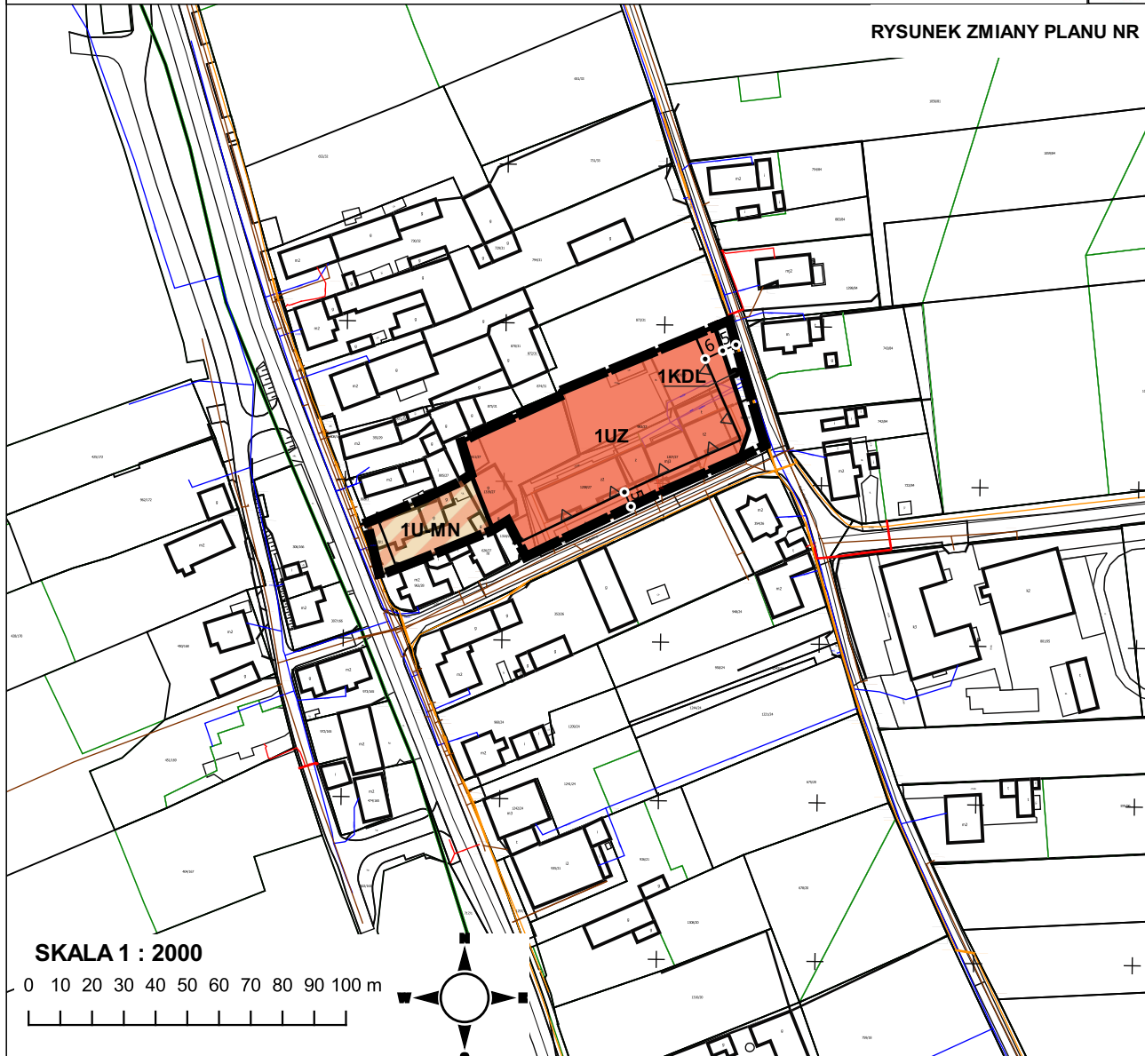
RYСУNEK ZMIANY PLANU NR 1

WYRYS ZE STUDIUM UWARUNKOWAŃ I KIERUNKÓW ZAGOSPODAROWANIA PRZESTRZENNEGO GMINY PRÓSKÓW PRZYJĘTEGO UCHWAŁĄ NR LIII/411/2023 RADY MIEJSKIEJ W PRÓSKOWIE Z DNIA 17 MARCA 2023 R.